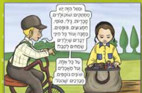
מתוך הספר "המברכים הצעירים", מאת ג.וינד